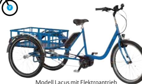
Modell Lacus mit Elektroantrieb