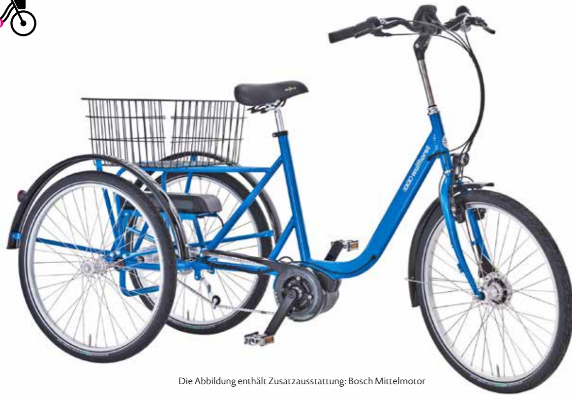
Die Abbildung enthält Zusatzausstattung: Bosch Mittelmotor