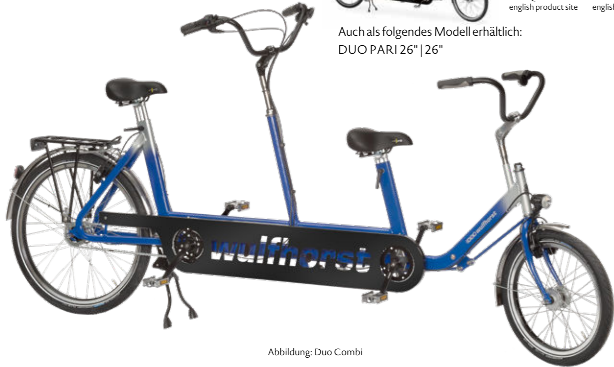
Abbildung: Duo Combi

Auch als folgendes Modell erhältlich: DUO PARI 26" | 26"