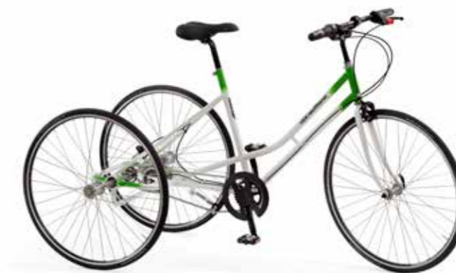
Curverahmen mit tieferem Einstieg