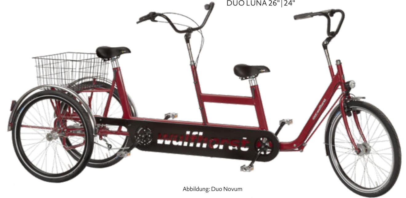
Abbildung: Duo Novum

Auch als folgendes Modell erhältlich: DUO LUNA 26" | 24"